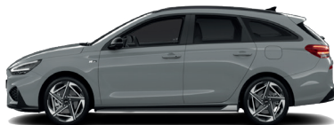
Shadow Gray – Pastelová 3 300 €