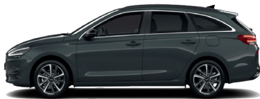
Cypress Green – Perleťová 690 €