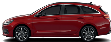
Ultimate Red – Metalická 690 €