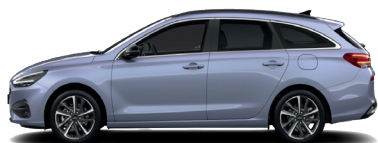
Meta Blue – Perleťová 690 €