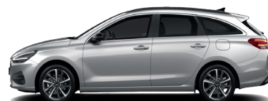
Shimmering Silver – Metalická 690 €