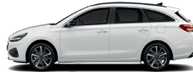
Atlas White – Pastelová 300 €