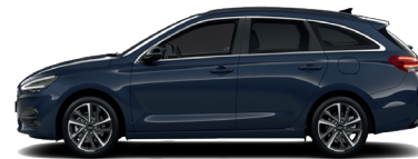
Sailing Blue – Perleťová 690 €