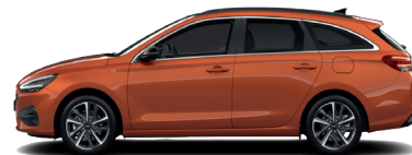
Jupiter Orange – Metalická 690 €