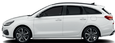
Serenity White – Perleťová 690 €