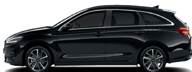
Abyss Black – Perleťová 690 €