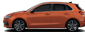
Jupiter Orange – Metalická 690 €