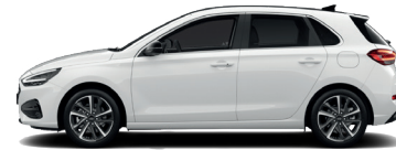
Atlas White – Pastelová 300 €