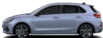
Meta Blue – Perleťová 690 €