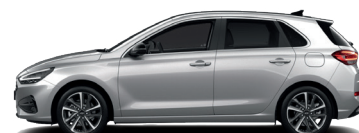
Shimmering Silver – Metalická 690 €