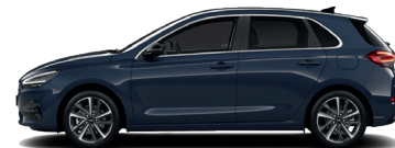
Sailing Blue – Perleťová 690 €