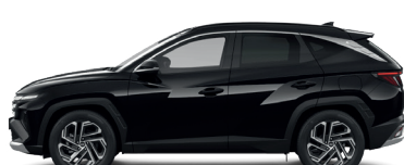
Abyss Black – Perleťová 760 €