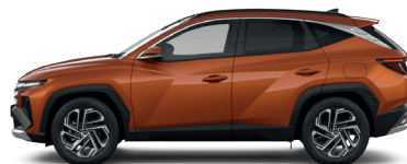
Jupiter Orange – Metalická 3 760 €