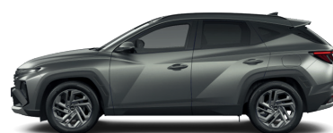
Pine Green – Matná 3,4 1 090 €