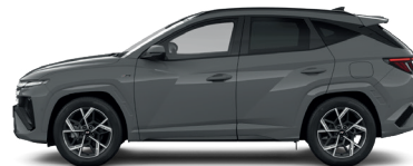
Shadow Gray – Pastelová 3 300 €