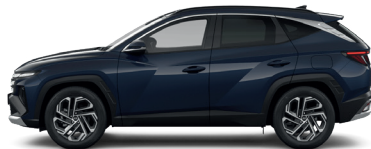
Sailing Blue – Perleťová 3 760 €