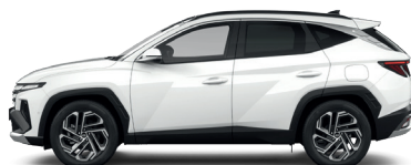
Atlas White – Pastelová 300 €