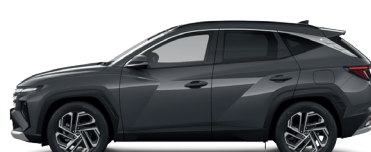
Ecotronic Gray – Perleťová 3 760 €