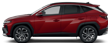
Ultimate Red – Metalická 3 760 €