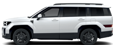
Creamy White – Matná 1 190 €