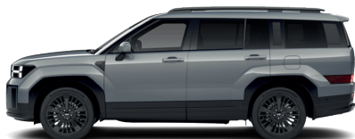
Pebble Blue – Perleťová 860 €