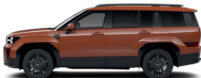
Terracota Orange – Pastelová 0 €