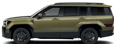
Ocado Green – Perleťová 860 €